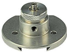
11-000355 HV35 ありつきベース