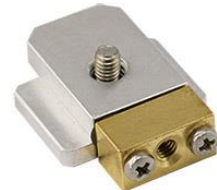
11-000341 HV40 older style T ベース