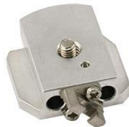
11-000348 HV48 new style T ベース